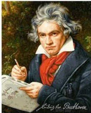
Ludwig van Beethoven