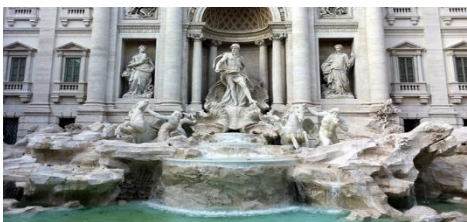
Fontanna di Trevi